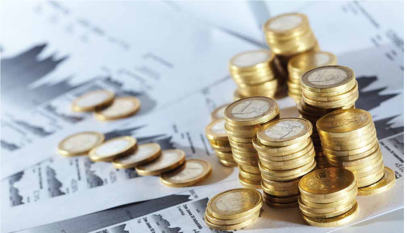
BẢNG DOANH THU TỪ NĂM 2010 - 2017

Từ những thành quả đạt được, CÔNG TY TNHH BÊ TÔNG & XÂY LẮP - PETROLIMEX hiện nay trở thành doanh nghiệp có nguồn tài chính mạnh, đảm bảo hoàn thành tốt các dự án mà Công ty đầu tư và tham gia thi công. Bên cạnh nguồn vốn chủ sở hữu, chúng tôi cũng đã có các mối quan hệ chặt chẽ và nhiều tổ chức tài chính, tín dụng tại Việt Nam, sẵn sàng ủng hộ nguồn tín dụng cho chúng tôi trong quá trình triển khai các dự án và phục vụ cho hoạt động kinh doanh của công ty.